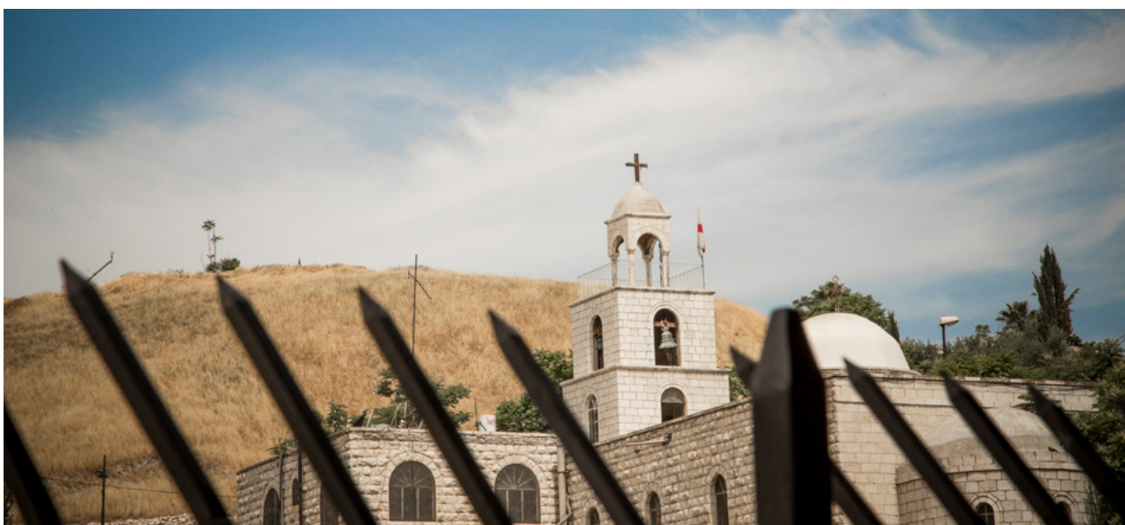
Religiös mångfald är en realitet både globalt, regionalt och lokalt. Det är inte ovanligt att religion och religiösa aktörer utnyttjas i konflikter. Bilden visar en kyrka i gränslandet mellan Israel och Jordanien.

En majoritet av dagens kristna bor eller har sitt ursprung i det globala syd eller öst och år 2050 beräknas fyra av tio kristna leva i Afrika söder om Sahara 31 . Detta innebär att den religiösa kartan fortsätter att ändras kraftigt. Fundamentalistiska