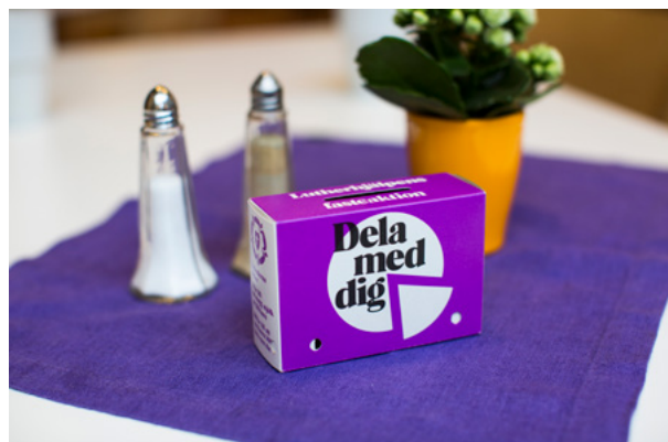
Insamlingsbössan i papper gjorde entré under Lutherhjälpens första riksomfattande fastekampanj 1965.

År 1947 bildades Lutherska världsförbundet i Lund, och den svenska sektionen blev efterhand känd under namnet Lutherhjälpen. Lutherhjälpen började som ett