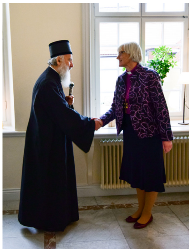
Ekumenik. Ärkebiskop Antje Jackelén hälsar Patriarken Irinej av Serbien välkommen. Patriarken Irinej besökte den serbisk-ortodoxa kyrkan i Sverige 2014 vid invigningen av katedralen S:t Savas i Enskede gård.

Ett ekumeniskt förhållningsätt är grundläggande i Act Svenska kyrkans identitet. 21 Vi är därigenom del av en större gemenskap av ömsesidigt beroende och gemensamt ansvar inför varandra, en gemenskap som vilar på en gemensam tro på den treeniga Guden