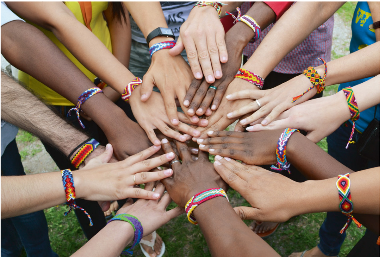
Utbytesprogrammet Ung i den världsvida kyrkan bidrar till att stärka relationerna mellan Svenska kyrkan och systerkyrkor i andra delar av världen. Genom programmet deltar svenska ungdomar i vardagsliv, församlingsliv och samhällsengagemang under tre månader, varefter ungdomar från samma platser vistas i svenska församlingar. 2024 sker utbyten med kyrkor i Filippinerna och Tanzania. På bilden vänskapsband som länkar samman 2013 års internationella deltagare.

demokratisk kultur, öka respekten för mänskliga rättigheter, göra beslutsfattare tillgängliga och ansvariga inför sina medborgare och bidra till en hållbar ekologisk, social och ekonomisk utveckling. Sammanhanget bestämmer vad som är möjligt att göra. Oavsett hur den specifika situationen ser ut vill Act Svenska kyrkan bidra till mötesplatser och möjliggöra erfarenhetsutbyten och kapacitetsstärkande åtgärder för att samarbetspartner i ännu större utsträckning ska kunna bli dynamiska civilsamhällesaktörer som förändrar kyrkor och samhällen i en riktning mot ökad demokrati och respekt för mänskliga rättigheter.