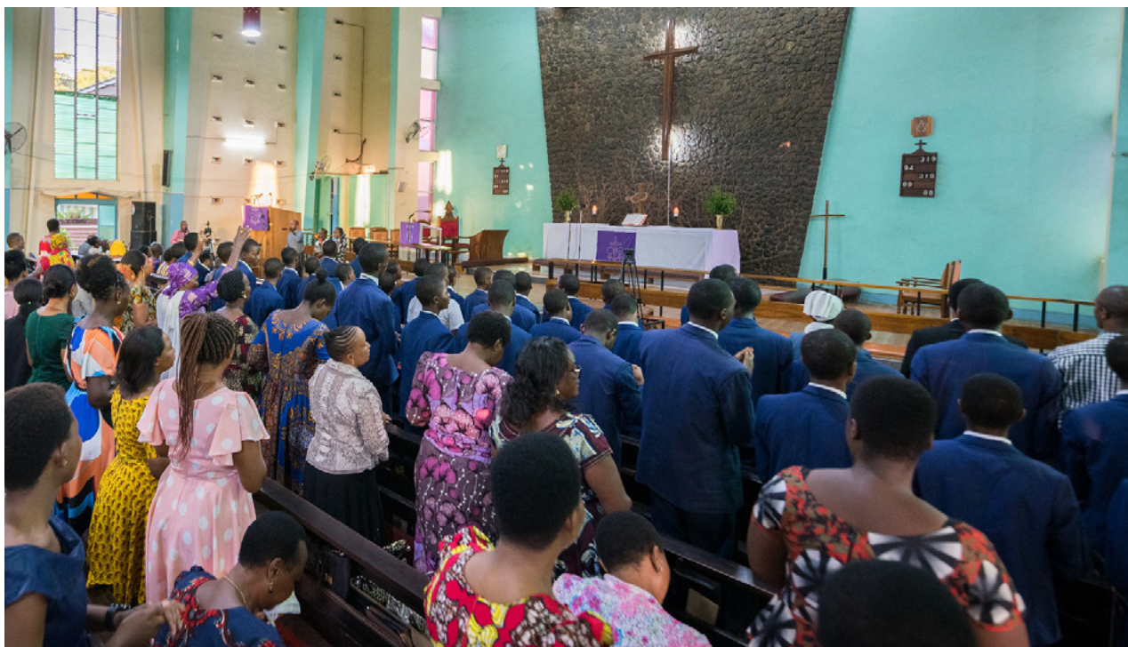
Gudstjänst i Lutherska katedralen i Moshi i Tanzania, 2022. Den lutherska kyrkan i Tanzania, Evangelical Lutheran Church in Tanzania, ELCT, är en av de kyrkor som SKM har samarbetat med under lång tid. Svenska kyrkan har fortfarande en nära relation med ELCT och Act Svenska kyrkan stödjer dess arbete för bland annat rätten till hälsa och jämställdhet.

Den kristna missionens internationella historia (den så kallade "yttre missionen") präglades tidigt av föreställningar om geografisk expansion från ett kristet centrum till de "onådda områdena i periferin", från de privilegierade till de marginaliserade. 4 Många delar betraktar vi i dag som problematiska, framför allt bristen på respekt för andras levnadssätt, religion och kunskaper, samt synen på olika folkgrupper. Bland annat förekom vid det förra sekelskiftet segregation inom Svenska kyrkans mission i Sydafrika, där de svarta medarbetarna inte fick äta samma mat som de vita missionärerna. 5 Fram till mitten av 1900-talet dominerade också föreställningen om att de kristna missionärerna kom med kunskap till de okunniga. Under senare delen av 1900-talet utvecklades i stället