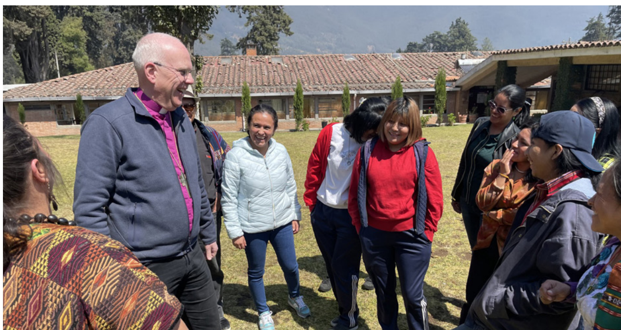
Lokal förankring och stark motivation att tjäna människor och samhällen är exempel på bidrag som många religiösa utvecklingsaktörer kan bidra med. På bilden syns ärkebiskop Martin Modéus tillsammans med representanter från organisationen COPAE i Guatemala, som driver en skola för att stärka politisk engagemang bland kvinnor i Mayafolket.

Religiösa aktörers möjligheter att ge distinkta bidrag i det humanitära arbetet – samtidigt som de följer de humanitära principerna om bland annat opartiskhet – uppmärksammas också alltmer. Det beror bland annat på att lokala aktörer värdesätts och prioriteras alltmer i det humanitära arbetet, och att religiösa aktörer är en betydande del av denna grupp lokala aktörer. Förståelsen för att människors religiösa övertygelser är betydelsefulla för människors hälsa och resiliens (motståndskraft) i humanitära situationer har också ökat. I tider av kris vänder sig människor ofta till sina religiösa företrädare och sammanhang för stöd och gemenskap. Act Svenska kyrkan har under lång tid byggt upp en särskild kompetens om ett psykosocialt förhållningssätt i det humanitära arbetet. Det psykosociala förhållningssättet bygger på en holistisk människosyn och förståelse för den andliga dimensionen i människors resiliens och återhämtning efter katastrofer. 52