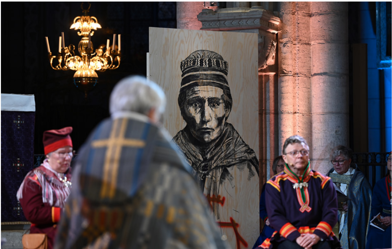
Svenska kyrkans roll i samhället har förändrats på flera avgörande sätt under de senaste decennierna. Den 23 oktober 2022 framförde ärkebiskopen en ursäkt till det samiska folket vid en högtidsgudstjänst i Luleå domkyrka. Det är symboliskt viktigt att ursäkten uttalades i Sämpe. Första gången ursäkten uttalades var i Uppsala den 24 november 2021.

och auktoritära väckelserörelser växer inom flera religioner och har inflytande både lokalt och globalt. Detta gör att även den ekumeniska rörelsen står mitt i betydande förändringar. 32