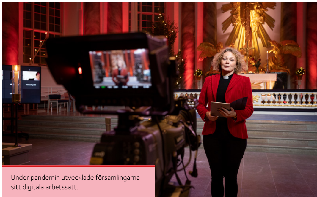
Under pandemin utvecklade församlingarna sitt digitala arbetssätt.

Till kyrkan är alla lika välkomna. Det gäller oavsett om man vill fira gudstjänst, lyssna på musik, sjunga i kör, samtala med någon, uppleva arkitektur och historia, reflektera, tända ett ljus eller delta i församlingens aktiviteter. Det erbjuds även grundläggande undervisning i kristen tro och det finns möjlighet till fördjupning för den som är intresserad.