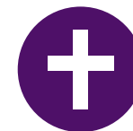
ILLUSTRATION: STINA LÖFGREN. SK 18167. LULESAMISKA.

Oajvvadusá dân affissjan li dâssjâ muhtema moattet dagos majt mij guorraulmutja máhttep surgulattjaj dahkat. Ale uhtseda binnep dagov, unnep dahko aj máhttâ ednagav mierkkit. Jus sidâ ienep doarjjagav jali soabmâsav gejna sâgasta de manâ tjoaggulvisdâhpâsit. Dân gâvna akta-vuohtadiedoht ja ienep duohta oajvvadusâjt webbabielen svenskakyrkan.se/forstahjelpenvidsorg